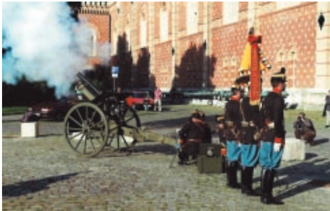
Salut der Traditionsbatterie der Reitenden Artilleriedivision N°2 vor dem Heeresgeschichtlichen Museum Wien.