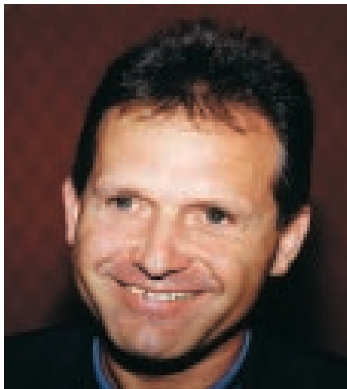
Minister Strasser: Verständnis für die Anliegen der Waffenbesitzer

Während des Gespräches ist sehr deutlich geworden, daß dieser Minister an einem einheitlichen und vor allem rechtskonformen Vollzug des Gesetzes äußerst interessiert ist. In den nächsten