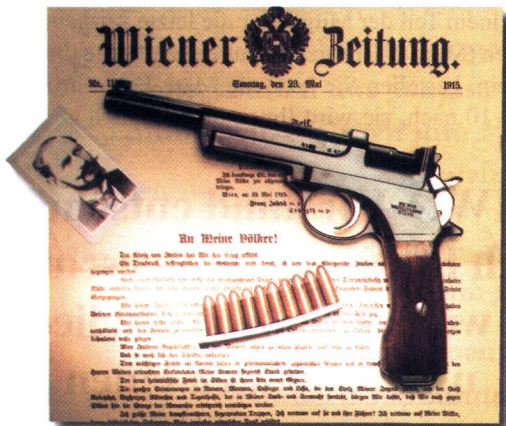
Mannlicher-Pistole 1905, Kal. 7,63 Mannlicher. Dieser Waffentyp wurde in Argentinien mit dem Staatswappen versehen als Ordonnanzmodell 1905 eingeführt.

Bei Gesprächen mit Sammlerkollegen höre ich häufig die Aussage „Bitte nur nicht an die Öffentlichkeit, nicht auffallen, das ist zu gefährlich.“ So dachten auch die britischen Waffenbesitzer - das Resultat ist bekannt: Kein Schießsport, kein Besitz und kein Sammeln von Faustfeuerwaffen aber eine Zunahme von Straftaten mit illegalen Schusswaffen. Unlängst las ich in einem Inserat: „Deutscher Meister gibt Sportgerät ab.“ Es war kein alter Turner, der seinen Barren hergeben, sondern ein Schütze, der seine Pistole verkaufen wollte! Wir müssen gemeinsam zu unserem Hobby stehen und man kann es nicht oft genug sagen: Auch Jä-