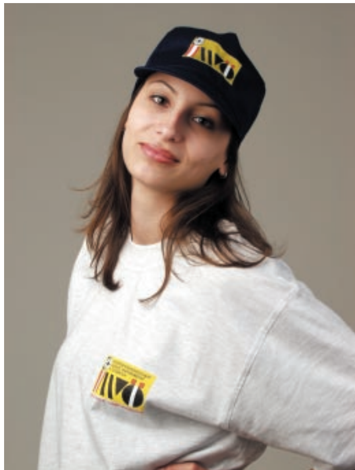
Die auf der JASPOWA im Februar präsentierten IWÖ-Kappen und T-Shirts sind ein großer Erfolg. Bestellbar um je ATS 150,- im IWÖ-Büro, telefonisch, per e-mail, Fax oder schriftlich !

Am Höhepunkt der Waffenhysterie schreckten Waffengegner die Öffentlichkeit mit der Meldung, in Österreichs Haushalten gäbe es weitaus mehr Waffen als bei Exekutive und Bundesheer zusammengenommen . Die meisten Medien äußerten pflichtschuldig Entsetzen und Besorgnis. Politiker aller Farbschattierungen entwickelten schleunig gesetzliche Strategien gegen diese vermeintliche Bedrohung der öffentlichen Sicherheit.