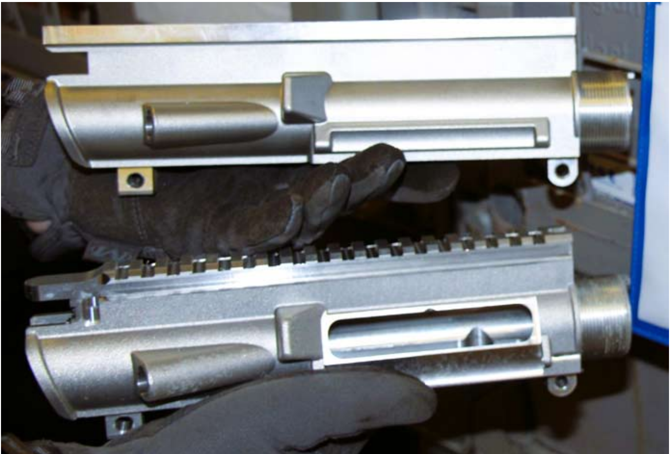
Diese Upper im Rohzustand „haben die Form einer Schußwaffe“ und sind „umbaubar“, aber noch keine „Kennzeichnung“ - 8 Jahre!

daß wir neuerliche Einschränkungen unserer Rechte befürchten. Wer garantiert die Richtigkeit der Behauptungen der Kommission, daß nicht ausschließlich die „Verbrecher“ im Fokus etwaiger neu zu erlassender Bestimmungen liegen, zumal es die vorgeschlagenen Tatbestände und Strafraumen gewaltig in sich haben.