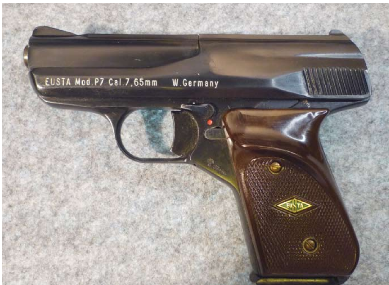
Abb. 1: Pistole EUSTA P7, Ansicht von links. Das „EUSTA“ Logo ist nur auf der linken Griffschale aufgebracht. Die Schlitzenbeschriftung ist eingegräst.

Man kann nicht alles haben. Muß man auch nicht, aber wollen darf man (besonders, wenn man ein Sammler ist). Was aber, wenn man etwas bekommen kann, das andere nicht wollen? Und wenn das auch noch ein echtes Kuriosum ist?