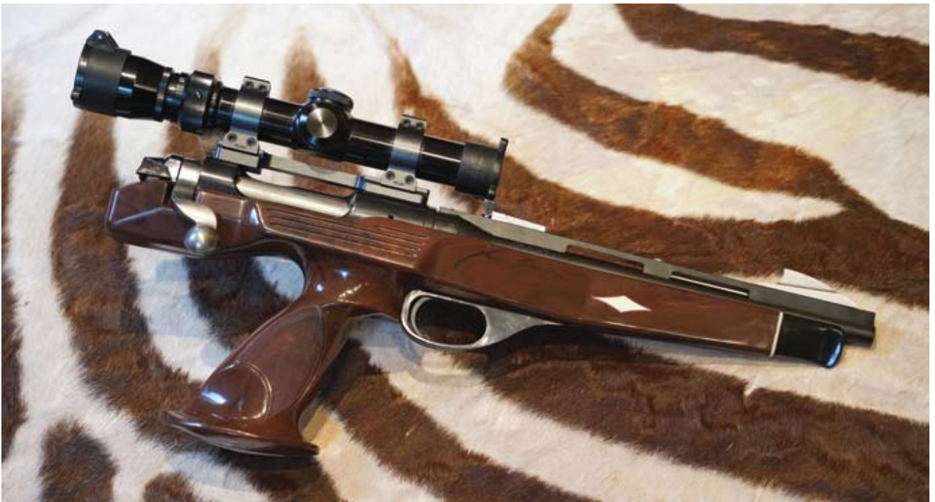
Remington XP-100 im Kaliber .221 Rem. Fireball mit jagdlicher Optik