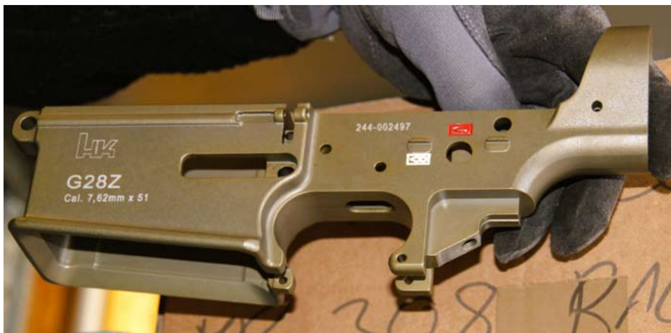
Dieser Lower wird ein „wesentlicher Bestandteil“ für ein selbst zusammengestelltes AR 10 - aber nur bei freiem WBK-Platz erlaubt.

Grundsätzlich wäre ja nichts dagegen einzuwenden, wenn es die richtigen trifft, aber wir als Vertretung der Legalwaffenbesitzer sind quasi schon „gebrannte Kinder“. Wenn man sich die Entwicklung der letzten Jahre ansieht, wird es wohl niemanden wundern,