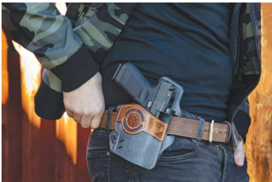
Verdecktes Führen einer Pistole

DEN VOLLSTÄNDIGEN ARTIKEL FINDEN SIE IN DER REGULÄREN AUSGABE ODER AUF WWW.IWOE.AT !